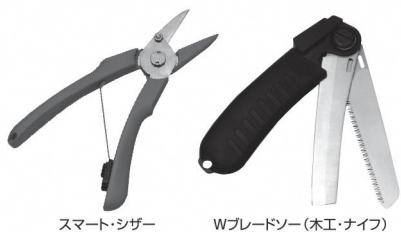
スマート・シザー