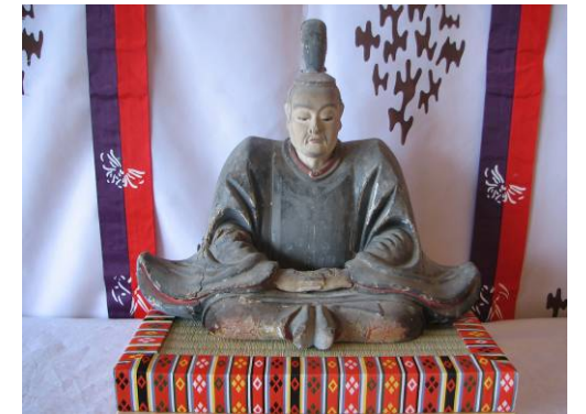
日吉神社に伝わる御戸開天満天神像 ～天神様～ 菅原道真は学問・出世の神様として親しまれています